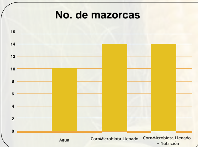
Figura 1. Comparación del no. de mazorcas entre los tratamientos.