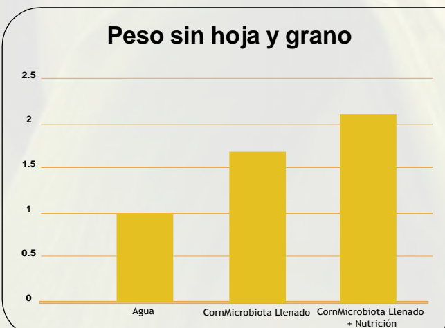
Figura 3. Comparación de los tratamientos con el peso sin hoja y con granos.