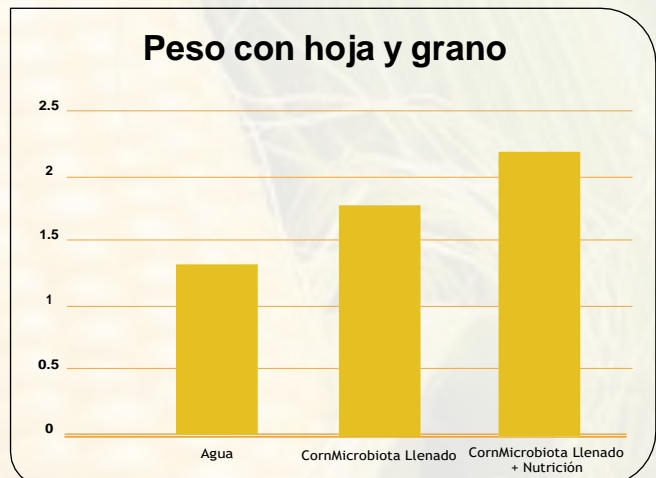
Figura 2. Comparación de los tratamientos con el peso con hoja y granos.